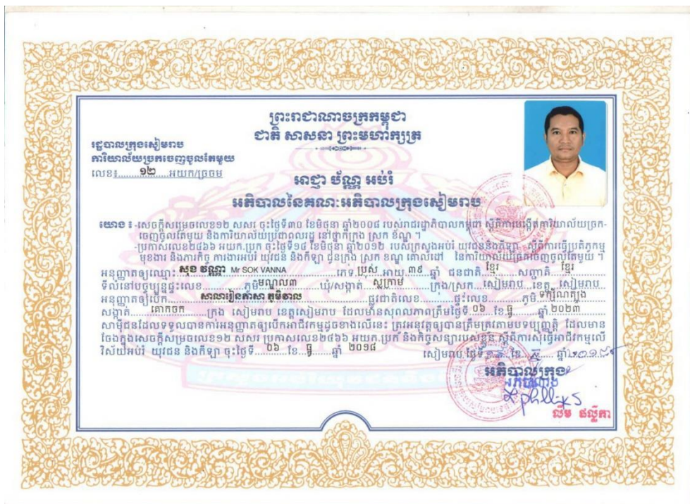
Vergunning waarin de basisschool van SOID als school wordt erkend